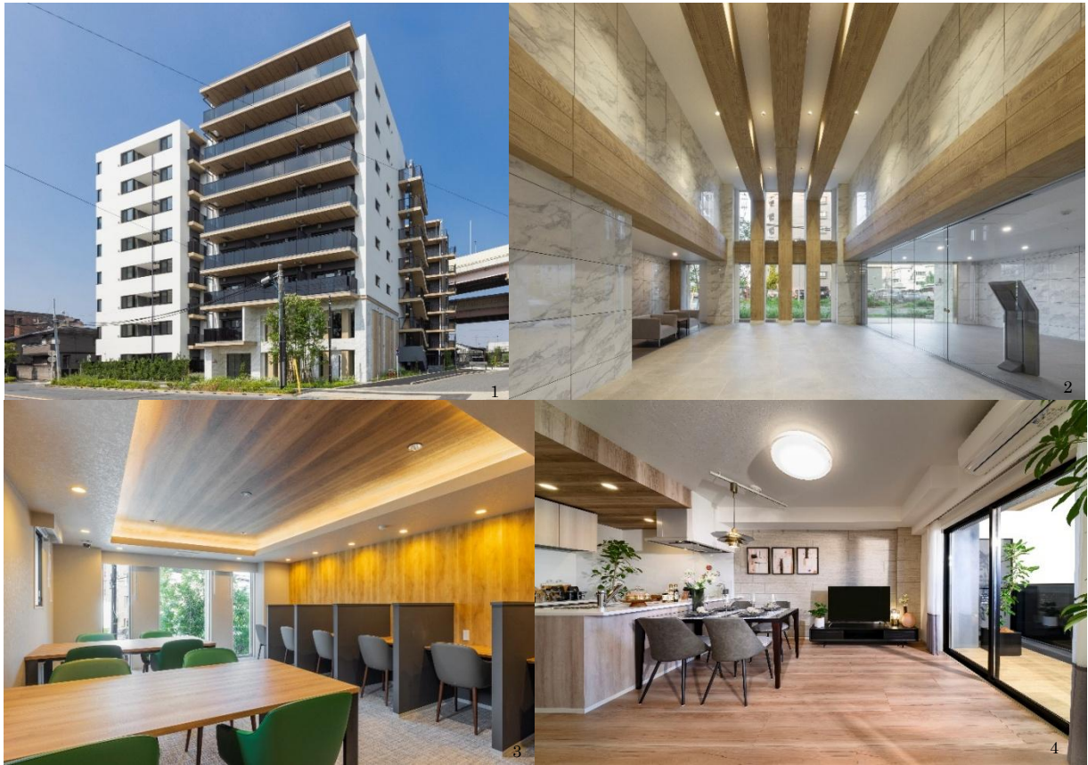
1.外観 2.エントランスホール 3.ワークラウンジ 4.リビング・ダイニング・キッチン (Gタイプ)